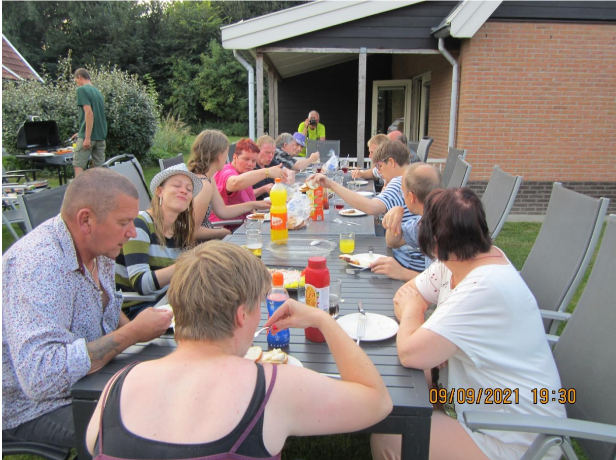
Weer lekker eten.