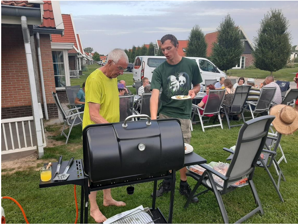
De mannen van de BBQ