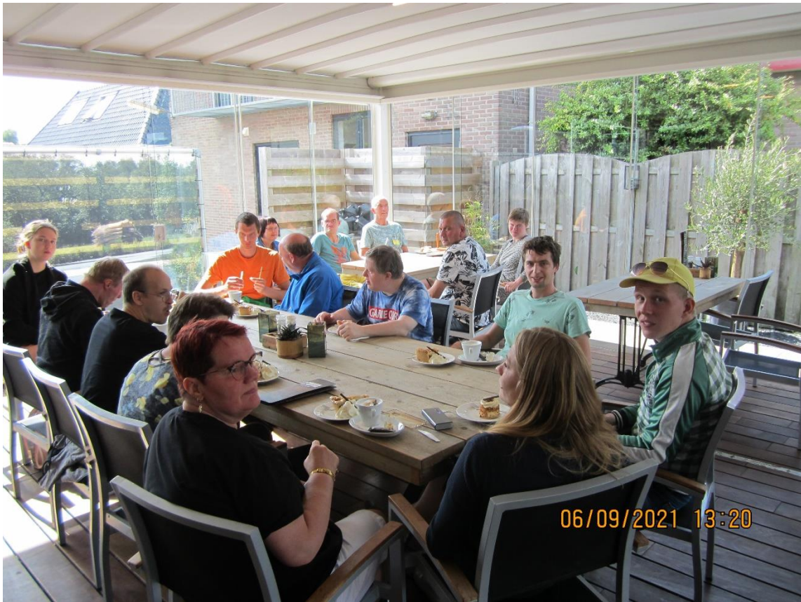
En als afronding aan ons bezoek zitten we op een terrasje ket koffie en appelgebak. Lekker smullen.